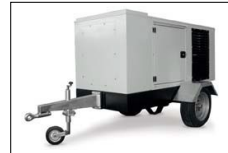
Carrello traino lento Slow speed trailer Chariot traction lente Carreta de baja velocidad