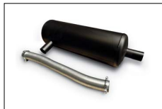
Marmitta residenziale per gruppi aperti Residential silencer for open gensets D'échappement résidentiel group ouvert Silenciador residencial para gen abiertos