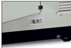
Innesti rapidi per collegamento cisterna est Quick connector for external tank Connecteur rapides pour réservoir externe Conector rápido para tanque externo