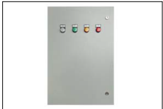
Quadro di commutazione Automatic transfer switch Inverseur de source Transferencia Automática

Su richiesta è disponibile una gamma completa di accessori. Verifica la disponibilità per ogni modello / versione. Full range of optional available on request. Check availability for each model / version. Tous les accessoires son disponibles sur demande. Vérifier la disponibilité pour chaque modèle / version. Está disponible, bajo petición, una amplia gama de accesorios. Consultar disponibilidad para cada modelo / versión.