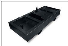
Vasca di raccolta liquidi motore Drip tray for engine liquid Tôle pour reculer le liquide du moteur Bandeja para derrame de líquidos de motor