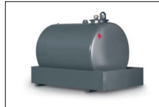
Cisterna separata Separate storage fuel tank Réservoir carburant séparée Tanque de combustible separado