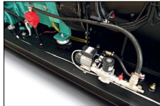
Dispositivo rabbocco automatico serbatoio Automatic refuelling device Dispositif remplissage automatique Recarga automática de combustible