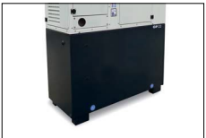
Serbatoio maggiorato Oversized fuel tank Réservoir carburant majorée Tanque de combustible a medida