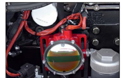
Dispositivo di rabbocco automatico olio Automatic lube oil refuelling system Remplissage automatique de l'huile Sistema de recarga automática de aceite