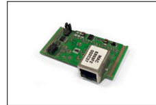
Modulo Ethernet web IB-Lite (COMAP) IB-Lite web Ethernet module (COMAP) Module Ethernet web IB-Lite (COMAP) Modulo Ethernet web IB-Lite (COMAP)