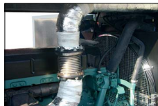
Compensatore gas di scarico Exhaust gas compensator Compensateur d'échappement Junta flexible para escape