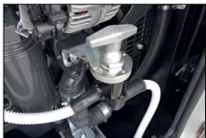
Stacca batteria Battery isolator switch Interrupteur batterie Interruptor de batería