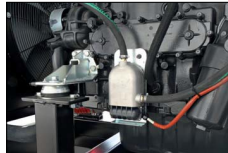
Scaldiglia acqua Water heater Préchauffage de l'eau Precalentador de agua