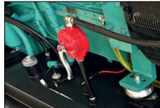
Pompa manuale travaso gasolio Manual fuel transfer pump Pompe manuelle de vidange carburant Bomba manual de combustible