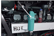
Pompa estrazione olio Oil drain pump Pompe manuelle de vidange huile Bomba manual de aceite