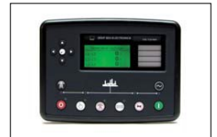
Centralina Deep Sea Electronic Deep Sea Electric control unit Contrôleur Deep Sea Electric Controlador Deep Sea Electric

Tutte le immagini ed i dati tecnici sono a titolo indicativo e potranno essere modificati senza preavviso. All images and technical data are for illustrative purposes and can be changed without prior notice. Toutes les images et les données techniques sont indicatives et peuvent être changées sans préavis. Todas las imágenes y los datos técnicos son ilustrativos y podrán ser modificados sin previo aviso.