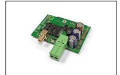
Modem GSM e internet GPRS (COMAP) GSM modem and internet GPRS (COMAP) Modem GSM et internet GPRS (COMAP) Modem GSM e internet GPRS (COMAP)