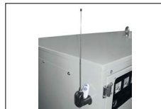
Radio comando Radio remote start Radiocommande Radio control