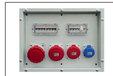
Kit prese aggiuntive Sockets kit Kit prises Kit de enchufes