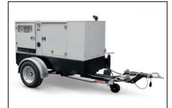
Carrello stradale Road trailer Chariot pour la roue Carreta para carretera