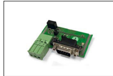
Convertitore RS232/RS485 (COMAP) RS232/RS485 Converter (COMAP) Convertisseur RS232/RS485 (COMAP) Convertidor RS232/RS485 (COMAP)