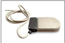
Scaldiglia olio Oil heater Préchauffage de l'huile Precalentador de aceite