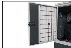
Filtro anti sabbia Anti sand filter Filtre anti sable Filtro anti arena