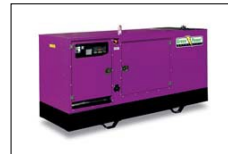
Colori e trattamenti speciali Colours and special treatments Couleurs et traitements spéciaux Colores y tratamientos especiales